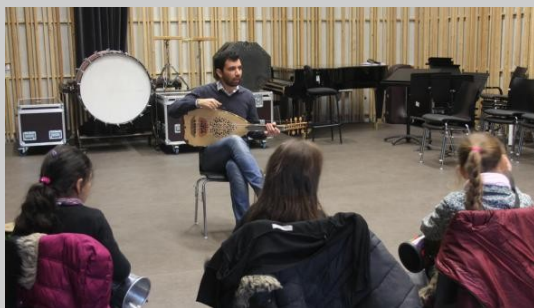
Lors de rencontres avec des groupes scolaires

« L'ouverture de la nouvelle classe a suscité l'intérêt d'une vingtaine d'élèves de 7 ans à l'âge adulte avec une volonté intense d'apprendre. Un tiers de vrais débutants, un autre d'élèves en cursus classique, et le dernier de personnes qui veulent entretenir une connaissance existante, culturelle ou familiale. Les instruments classiques côtoient les luths, les mandolines, la darbouka. Et surtout le chant et l'apprentissage de la langue arabe sont des clés de la transmission. Plus qu'une musique, c'est la culture algéro-andalouse (il préfère ce terme à arabo-andalouse) qu'il vient transmettre à Roubaix. » (La Voix du Nord 08/02/2014)